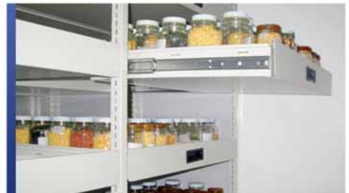
Tiroirs coulissants pour collection de spécimens