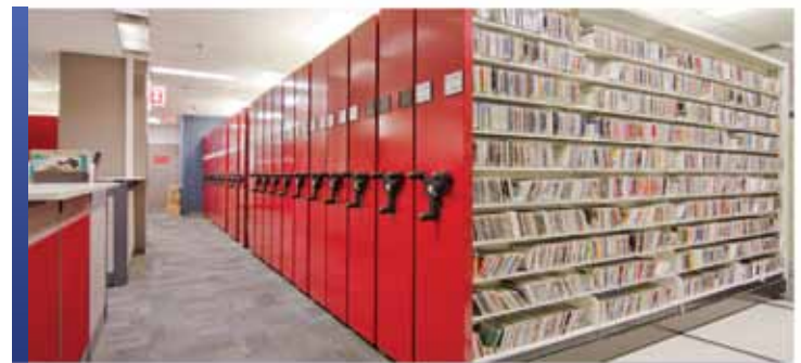
Rangement audiovisuel avec mobile et rayonnage 4-montants

Quelle que soit la nature ou la forme, Montel offre une solution de rangement pour collections de films et de matériel audiovisuel spécialement conçue pour assurer la préservation et la conservation des supports. Depuis les systèmes de rangement mobiles jusqu'aux systèmes de rayonnage fixes, nos solutions de rangement conçues sur mesure, avec un éventail de fonctionnalités et d'accessoires, fourniront une sécurité maximale et une excellente organisation pour les besoins de vos collections.