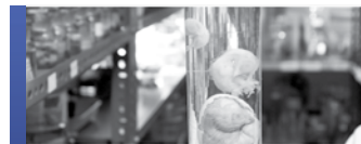
Collections dites humides