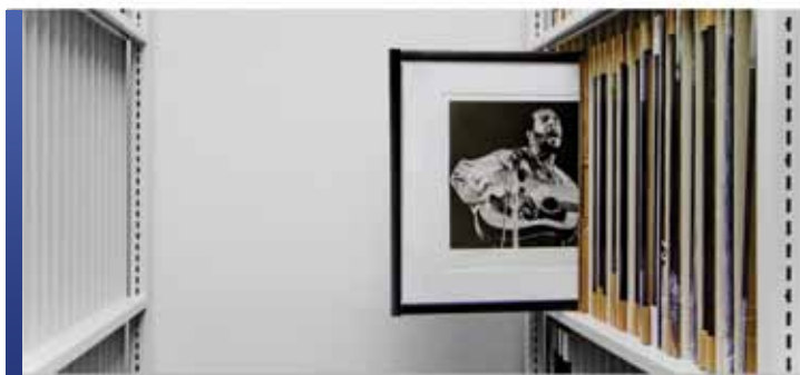
Rangement spécialisé pour collection d'imprimés

Pour vos travaux distingués sur papier qui prennent de l'âge, notre vaste gamme de systèmes de rayonnages mobiles et stationnaires de haute technicité offre des caractéristiques de conception et de flexibilité afin d'optimiser et de conserver en toute sécurité vos précieuses collections. Pour mieux accueillir les imprimés et les dessins, des tiroirs et des plateaux offerts en plusieurs configurations permettent d'assurer que vos précieuses collections sont correctement rangées et protégées, pour une conservation et une sécurité maximales.