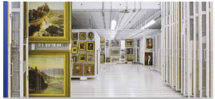
Panneaux de rangement coulissants fixés au plancher

Facilitant la gestion des collections et aidant à prévenir les dommages coûteux, les panneaux coulissants de Montel sont devenus le système de panneaux de rangement de choix pour de nombreux musées et galeries de renom.