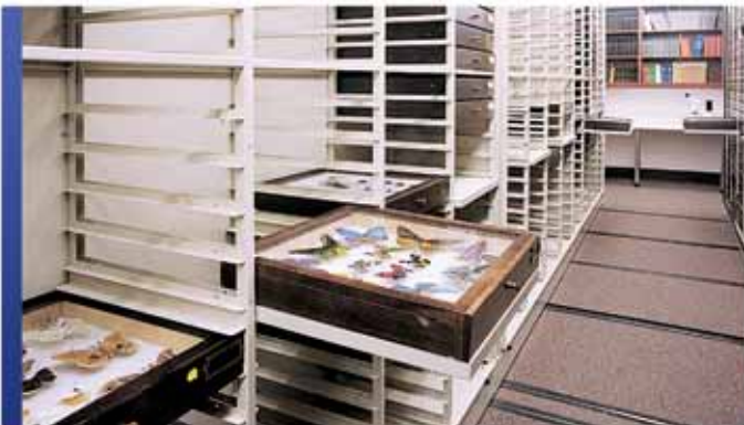
Rangement spécialisé pour spécimens

Chez Montel, nous sommes pleinement conscients de nos responsabilités lorsque nous proposons, élaborons et construisons des systèmes de rangement uniques qui doivent préserver non seulement des œuvres d'art de valeur, mais aussi l'intégrité et l'essence même des installations qui les abritent.