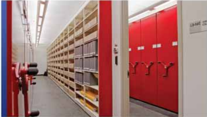
Rangement mobile pour collection spéciale