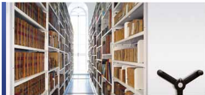
Rangement de livres rares avec mobile et rayonnage 4-montants

Chez Montel, nous savons que vous consacrez le même soin aux livres rares et aux manuscrits de vos collections. C'est pourquoi nous avons mis au point la référence en matière de rayonnage innovant pour veiller à ce que vos documents d'histoire, de littérature, de musique, d'art, de sciences et d'histoire naturelle soient préservés et gérés de manière appropriée. Grâce à nos solutions de rangement spécialisées, vos parchemins, vos encyclopédies, votre littérature, votre poésie, vos romans et vos boîtes et archives sont entre bonnes mains.