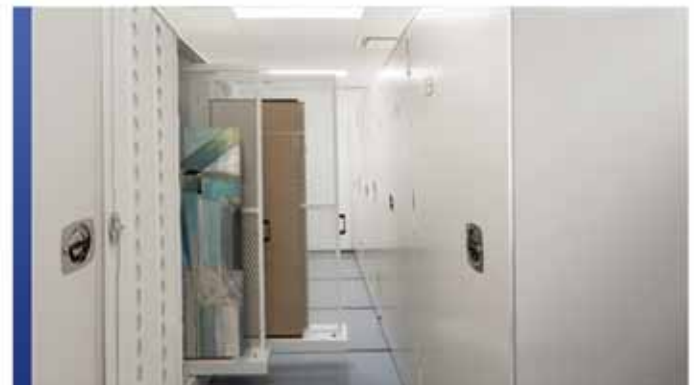
Cabinets de rangement pour textiles