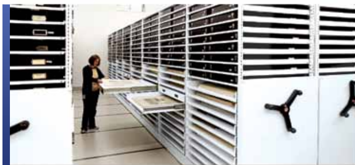
Collection d'imprimés et de dessins avec mobile et rayonnage 4-montants

Offrir un bon environnement, une manipulation sécuritaire et un rangement efficace est essentiel à la préservation de vos collections d'imprimés et de dessins. Puisqu'il vaut mieux ranger les objets en papier à plat plutôt que de les plier et déplier, ce qui peut conduire à la formation de crevasses et de déchirures, Montel offre un large éventail de méthodes de rangement afin de bien protéger vos collections.