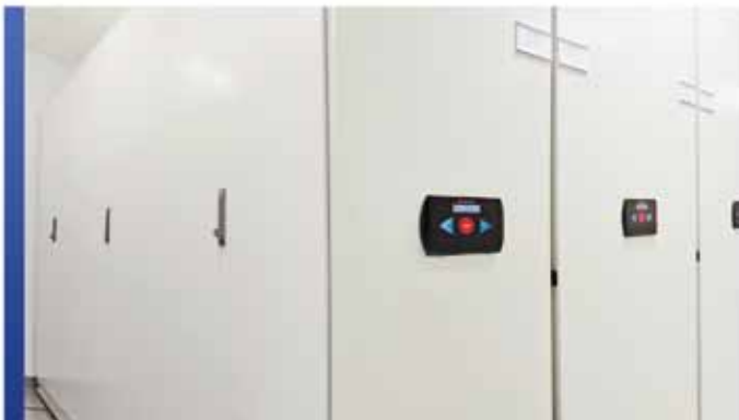
Rangement mobile motorisé

Pour économiser ou gagner de l'espace, nos systèmes de rangement mobiles offrent les toutes dernières fonctionnalités de conception et de sécurité pour accueillir vos collections uniques. Grâce aux systèmes de rangement électriques mobiles à haute densité, tirer le meilleur parti de votre espace alloué est un facteur clé, mais la sécurité est également essentielle. SafeAisle®, un système à la fine pointe de la technologie pour vos collections, vous offrira la tranquillité d'esprit sur ces deux aspects. Sa technologie LED Guard Technology MD vise à vous fournir la plus haute des sécurités en matière de rangement ainsi que pour votre personnel. Vous pouvez aussi sélectionner le système de rangement avec assistance mécanique Mobilex® haut de gamme de Montel, muni d'un frein de sécurité mécanique breveté, pour optimiser l'aire de rangement tout en maximisant vos inestimables collections.