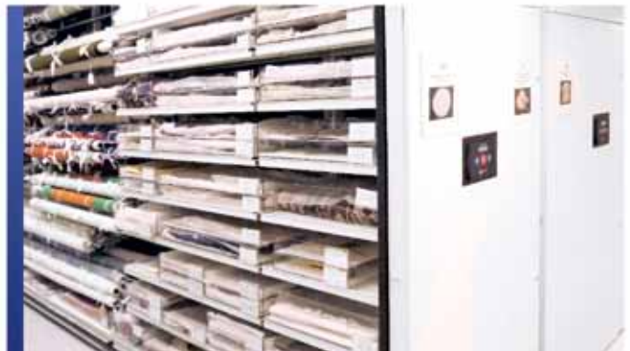
Rangement mobile motorisé pour collection de vêtements et tissus