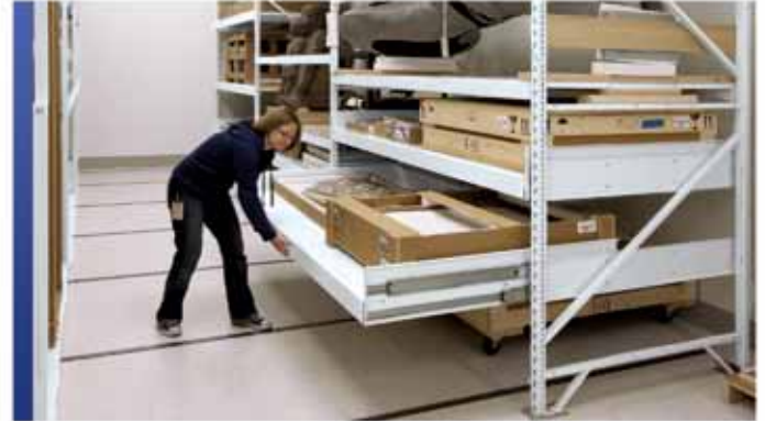
Tiroirs spécialisés pour collection d'artefacts

Que vous recherchiez des solutions de rangement mobiles ou des applications stationnaires traditionnelles, permettez-nous de partager les détails uniques des systèmes de rayonnage exclusifs de Montel, qui offrent une flexibilité, une force et une rigidité supérieures. Peu importe la forme et la taille, vous pouvez compter sur notre système de rayonnage hybride à quatre poteaux SmartShelf®, notre système de rayonnage cantilever Aetnastak® ou notre rayonnage 4D grande portée pour la préservation et la sécurité maximales de vos collections.