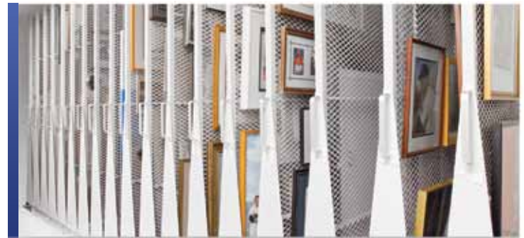
Panneaux latéraux de rangement mobiles