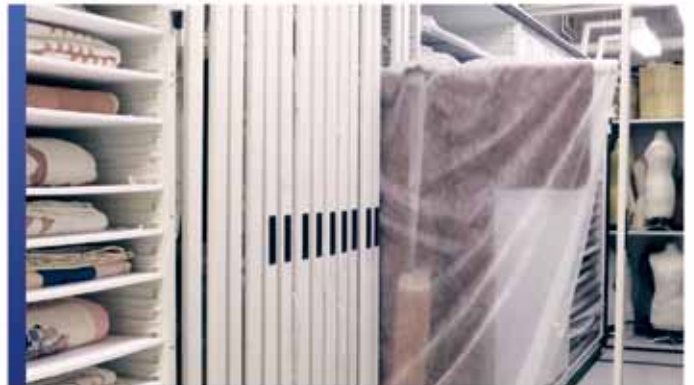
Rangement spécialisé pour collection de vêtements

De l'anthropologie à la zoologie, les produits de rangement de Montel font une utilisation intelligente de votre espace afin de bien gérer les artefacts, les spécimens, les peintures, les photos, les sculptures, les cadres, les archives, les fichiers, les dossiers, les boîtes et bien plus encore. Faites confiance à Montel pour vous aider à maîtriser l'art du rangement.