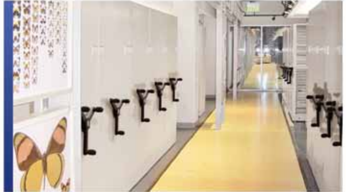
Rangement mécanique assisté

Pour économiser ou gagner de l'espace, nos systèmes de rangement mobiles offrent les toutes dernières fonctionnalités de conception et de sécurité pour accueillir vos collections uniques. Grâce aux systèmes de rangement électriques mobiles à haute densité, tirer le meilleur parti de votre espace alloué est un facteur clé, mais la sécurité est également essentielle. SafeAisle®, un système à la fine pointe de la technologie pour vos collections, vous offrira la tranquillité d'esprit sur ces deux aspects. Sa technologie LED Guard Technology MD vise à vous fournir la plus haute des sécurités en matière de rangement ainsi que pour votre personnel. Vous pouvez aussi sélectionner le système de rangement avec assistance mécanique Mobilex® haut de gamme de Montel, muni d'un frein de sécurité mécanique breveté, pour optimiser l'aire de rangement tout en maximisant vos inestimables collections.