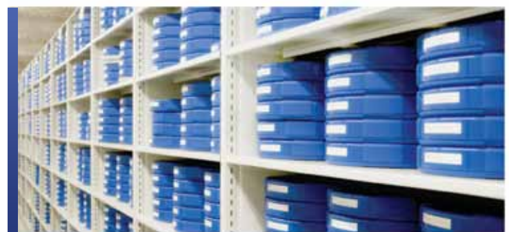
Rangement spécialisé pour collection de films