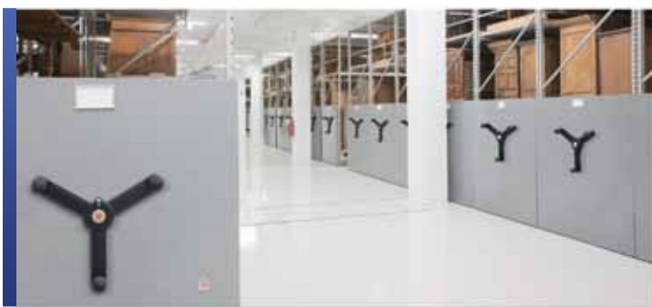
Collection de grandes tailles avec rangement mobile

Les systèmes de rayonnage fixes ou mobiles de grande envergure de Montel assurent le rangement sécuritaire des objets surdimensionnés et lourds. Les montants, supports et tablettes des étagères 4D de Montel sont conçus et fabriqués spécialement pour le marché des musées, car ils surpassent les normes de l'industrie en matière de flexibilité, soutiennent des charges plus lourdes et peuvent accueillir des objets de différentes hauteurs.