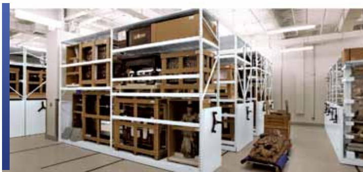
Rangement mobile avec rayonnage 4D longue portée