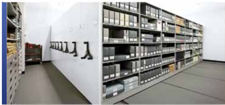
Rangement d'archives avec mobile et rayonnage 4-montants

Montel comprend l'importance des besoins en matière d'entretien et de conservation des collections dans les musées d'aujourd'hui. Quand il s'agit de créer des solutions innovantes et rentables pour les collections de livres rares, de manuscrits et d'archives, Montel ouvre la voie avec des solutions de rangement polyvalentes mobiles et fixes qui font une utilisation efficace des zones limitées de rangement des musées tout en facilitant l'utilisation efficace des étagères et l'extraction.