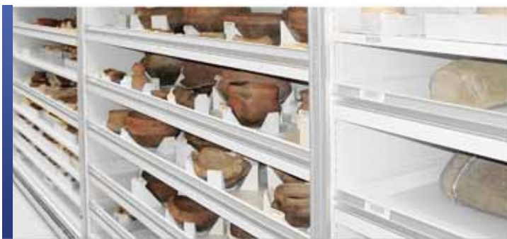
Tiroirs robustes pour artefacts

Avec une flexibilité et un réglage infinis, Montel offre ses étagères de rangement SmartShelf exclusives et conçues de façon unique. Grâce à une vaste sélection de tablettes et d'accessoires, SmartShelf permet des solutions de rangement innovantes et sûres pour tous les types de collections. Comme dispositif autonome ou installé sur nos chariots mobiles, ce système de rayonnage veillera à ce que les collections d'artefacts et d'objets 3D soient correctement rangées pour une protection à long terme.