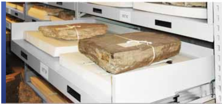
Collection d'artefacts sur tiroirs conçues sur mesure

La diversité des formes et des tailles que l'on trouve dans les collections d'artefacts et d'objets 3D que les musées doivent préserver nécessite souvent des solutions de rangement conçues sur mesure. Quels que soient les facteurs environnementaux ou les conditions de rangement, l'entreposage approprié de la collection constitue un facteur important qui influence sur la conservation et la viabilité à long terme.