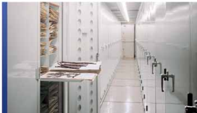
Cabinets de rangement pour herbiers

Quelles que soient vos collections à ranger, Montel peut offrir une gamme variée de cabinets soigneusement conçus pour répondre à vos besoins particuliers. Avec une conception flexible et un large éventail d'options, notre vaste sélection de cabinets permettra de protéger vos collections les plus précieuses tout en économisant l'espace au sol.